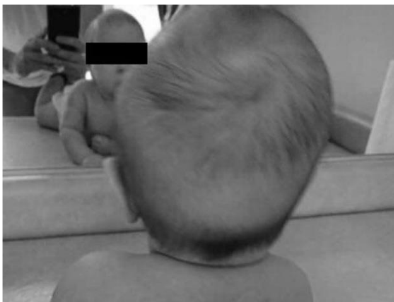
Fot. 1C. Widoczna asymetria czaszki – okolicy potylicznej