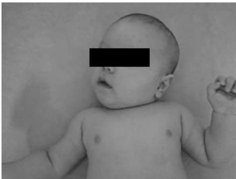
Fot. 1B. Ułożenie dziecka w leżeniu na plecach; przygięcie boczne głowy w stronę zmienionego mięśnia m-o-s. i skręcenie w stronę przeciwną