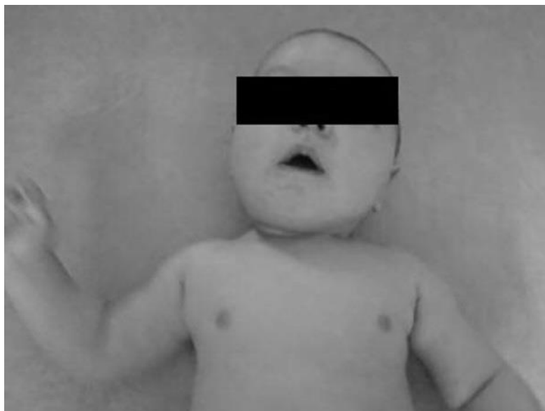
Fot. 1A. Ułożenie głowy dziecka w leżeniu na plecach; przygięcie boczne głowy w stronę zmienionego mięśnia m-o-s

Fotografie 1A, 1B, 1C przedstawiają ułożenie głowy dziecka z wrodzonym kręcem szyi pochodzenia mięśniowego potwierdzonym w badaniu ultrasonograficznym szyi. Wynik badania: po stronie lewej pogrubienie mięśnia m-o-s w \frac{2}{3} dalszych z zatarciem jego struktury na długości 25 mm, grubości 10 mm. Po stronie prawej prawidłowy mięsień m-o-s grubości 4 mm.